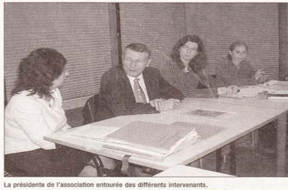
La présidente de l'association entourée des différents intervenants.

A l'issue de ce débat, les rapports moral et financier étaient adoptés à l'unanimité et un nouveau bureau devrait être constitué dans les prochains jours, suite au départ d'un membre de l'association. La séance se terminait par la dégustation de galettes des rois.