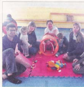
Lors d'un accueil à l'école des Allées...